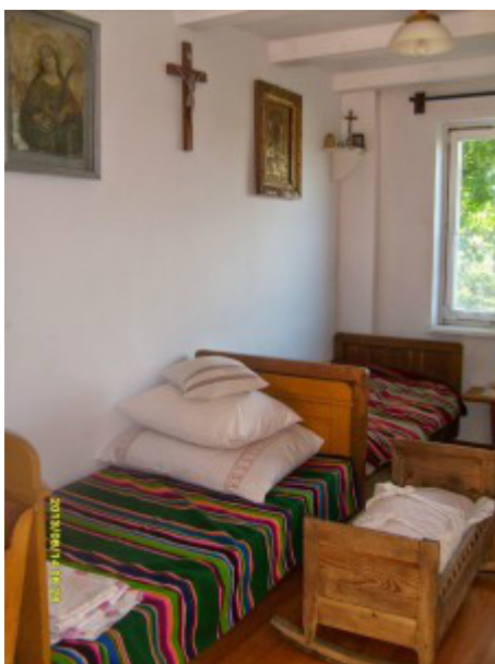
Izba chłopska - z okresu międzywojennego

Do dyspozycji gości są: jeden pokój 2-osobowy oraz jeden pokój 4-osobowy.