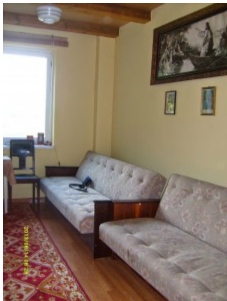
Wystrój pokoju: Średni PRL – lata 60