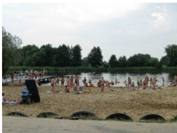
Kąpielisko Niwa

Ponadto, 3 km od tego gospodarstwa znajduje się las, do którego można wybrać się na grzybobranie. Niewątpliwie atutem położenia gospodarstwa agroturystycznego jest bliskość Wisły (ok 2 km) oraz stawów rybnych w Bąkowcu (4 km od kwatery agroturystycznej), co ma znaczenie dla osób, których zainteresowaniem jest wędkarstwo. Sieciechów znajduje się 10 km od Dęblina, w którym oprócz niedawno otworzonego Muzeum Sił Powietrznych jest wiele innych atrakcji do zwiedzania np. twierdza.