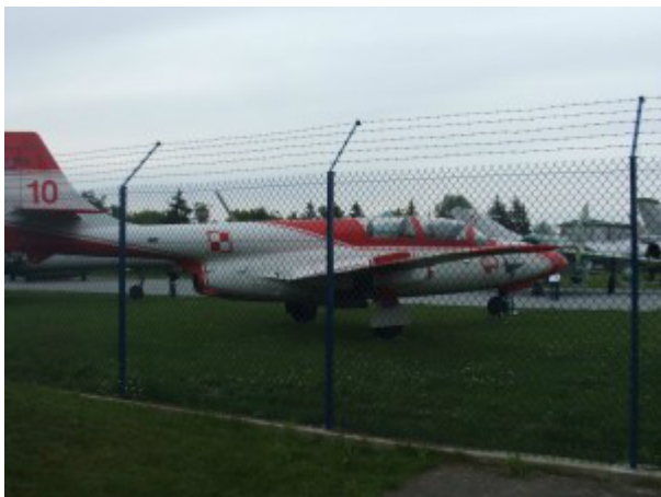
Muzeum lotnictwa w Dęblinie